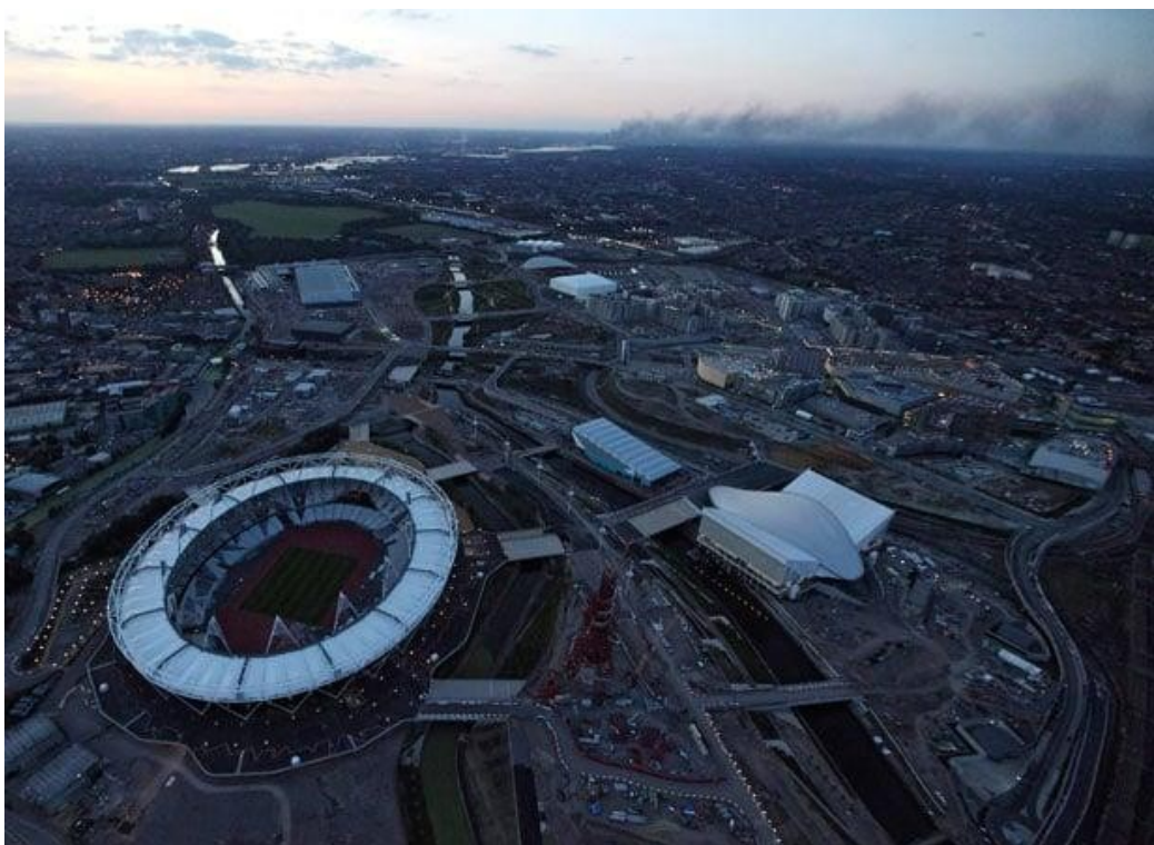
Stade olympique et Centre aquatique avec, au loin, l'entrepôt Sony au Nord de la ville présent sur la page précédente encore fumant, août 2011.

Le 4 août 2011, les flics tuent Mark Duggan, donnant lieu à une rage émeutière pendant plusieurs jours. Une personne racisée de plus dans les mémoires des assassinats policiers et, si elle habitait Tottenham, un quartier pauvre de la capitale, c'est dans plusieurs autres villes du Royaume-Uni que se propagent des révoltes qui iront attaquer la police, incendier des voitures, piller des magasins, détruire des bâtiments. Peu de temps avant les J.O. de Londres 2012, un texte publié sur le blog Dark Nights "The Bosses Grand Idea – The Olympic Spectacle of Money and Power", et consultable sur la même source qui a servi de traduction à la chronologie qui suit, se termine ainsi : « Ce qui les terrifie est la perspective d'une frange incontrôlable qui n'achète pas l'image amicale, ceux qui ne se laissent pas intimider dans une soumission totale par la démonstration de force, ceux qui voient à quel point ces bâtards nous éloignent d'une vie pleine de sens et qui peuvent trouver les failles dans le mur qui sépare ceux qui ont tout et ceux qui n'ont rien. En août 2011, une explosion de colère a secoué les cœurs de la pauvreté et de l'exploitation, et les émeutes ont laissé un héritage brûlant qui dévoile à quel point ce mur peut être fin. Retournons-y encore une fois, plus fort que jamais, jusqu'à ce que toute la mascarade pourrie s'effondre ! POUR UN DEUXIÈME ÉTÉ DE FEU – MORT À LEUR RÊVE DE MISÈRE ORDONNÉE / Cramez les J.O. »