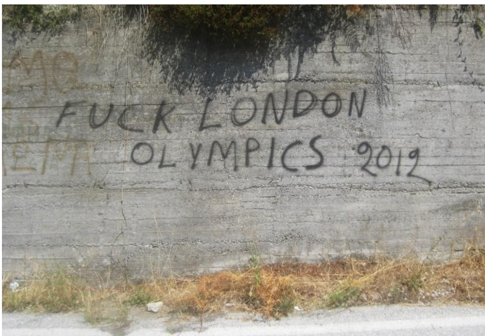
Halkidiki (Grèce), août 2012

13.08.12, Athènes, Grèce : F.A.I. "Feu aux ateliers textiles" a enclenché un engin incendiaire à un bureau d'investissement immobilier. « Nous sommes témoins des contradictions les plus extrêmes qui sont nées et meurent dans ce monde de merde. Tandis que les calculateurs des statistiques économiques comptent 23 000 morts en Syrie, des milliards de gens regardent les Jeux Olympiques de Londres abrutis ; la distance entre les JO et le coup "pratique" dans le champ des opérations est juste un simple bouton à pousser sur la télécommande. »